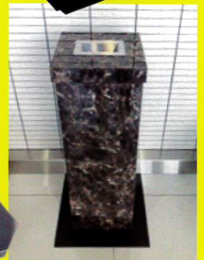
ハイグレードオーダー