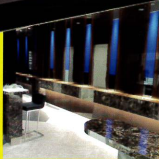
ハイグレードオーダー