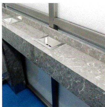
『スモカ』は、その名の通りカウンター型のため、新幹線の喫煙ルームのように狭いスペースでも有効活用できる。